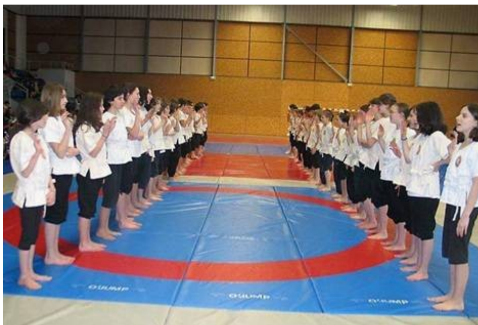
Lutttes d'hiver en gymnase - prestation de serment lors de chaque rencontre